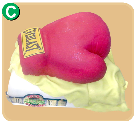
Forrada 707 disponible desde 30 porc.