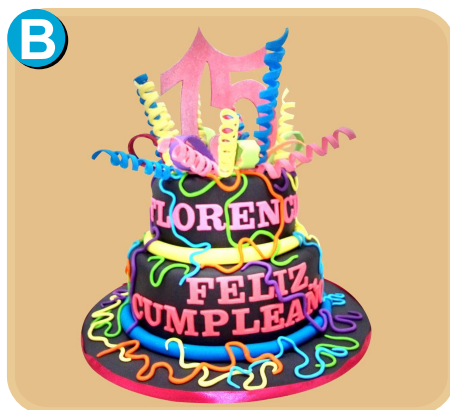
Forrada 505 disponible desde 30 porc.