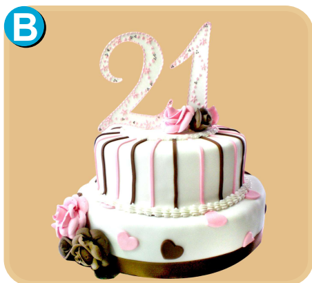
Forrada 513 disponible desde 30 porc.