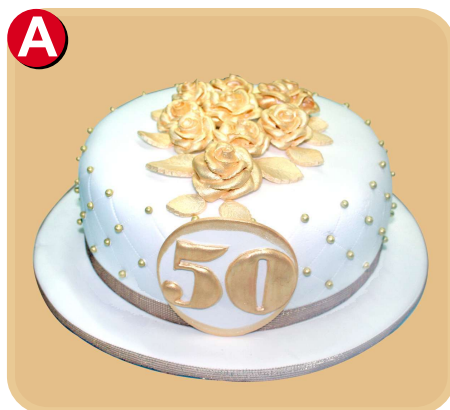
Forrada 514 disponible desde 20 porc.