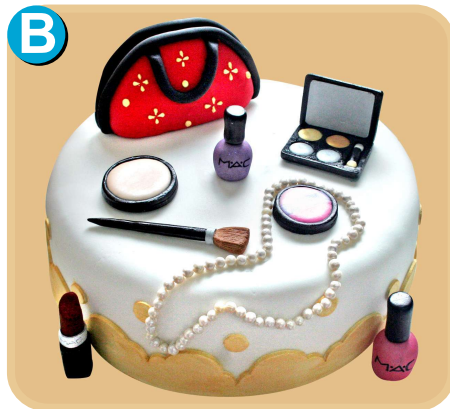
Forrada 611 disponible desde 15 porc.