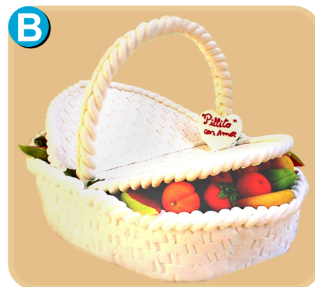
Forrada 606 disponible desde 20 porc.