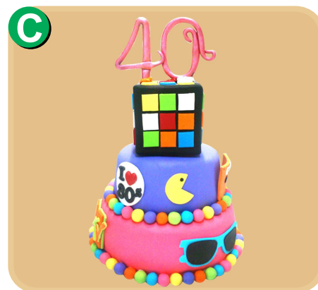
Forrada 709 disponible desde 30 porc.