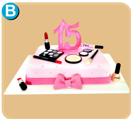
Forrada 504 disponible desde 15 porc.