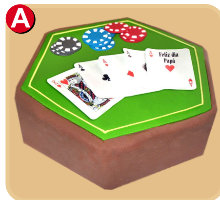
Forrada 706 disponible desde 10 porc.