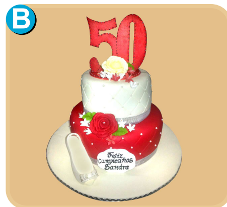
Forrada 515 disponible desde 30 porc.