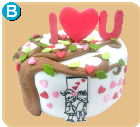
Forrada 617 disponible desde 10 porc.