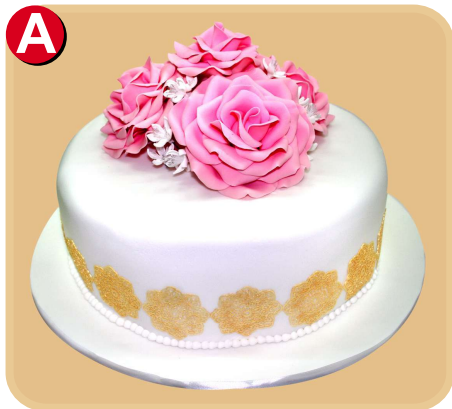
Forrada 610 disponible desde 15 porc.