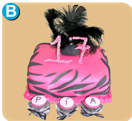
Forrada 508 disponible desde 15 porc.