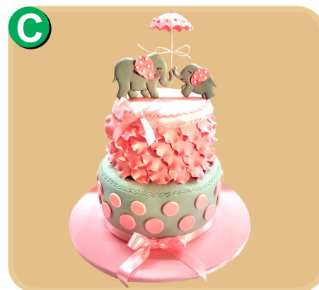
Forrada 609 disponible desde 30 porc.