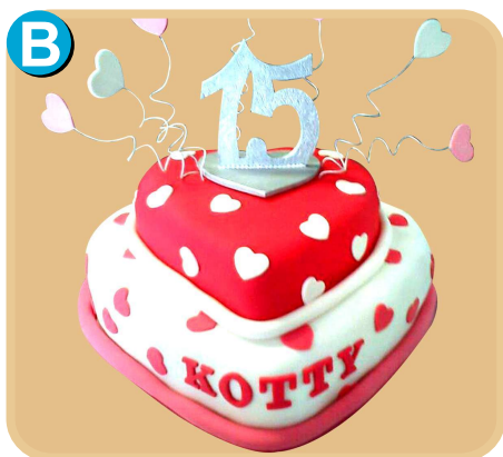
Forrada 507 disponible desde 30 porc.