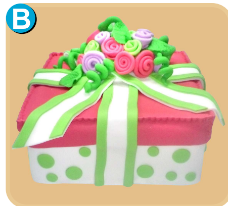
Forrada 615 disponible desde 15 porc.