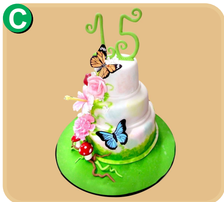
Forrada 501 disponible desde 45 porc.