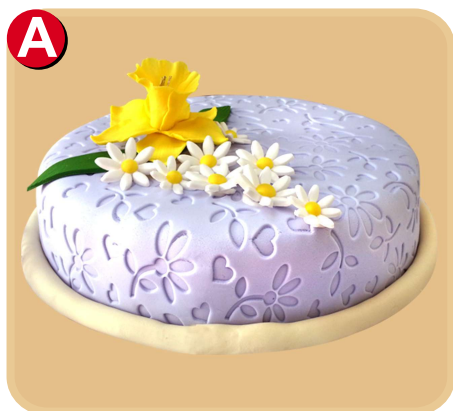
Forrada 607 disponible desde 15 porc.