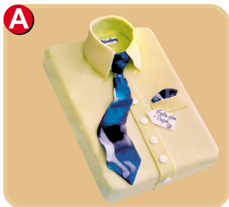
Forrada 713 disponible desde 15 porc.