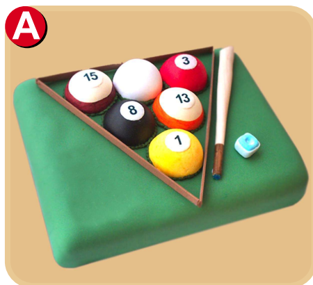
Forrada 705 disponible desde 15 porc.