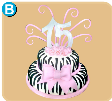
Forrada 502 disponible desde 30 porc.