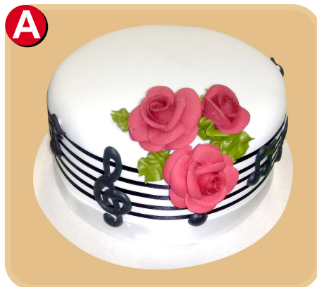
Forrada 614 disponible desde 10 porc.