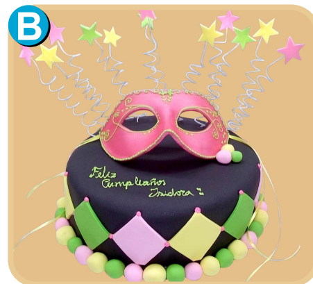
Forrada 618 disponible desde 15 porc.