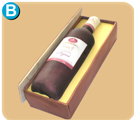
Forrada 710 disponible solo de 10 porc.