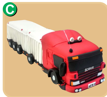
Forrada 718 disponible desde 30 porc.