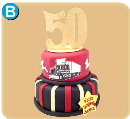
Forrada 516 disponible desde 30 porc.