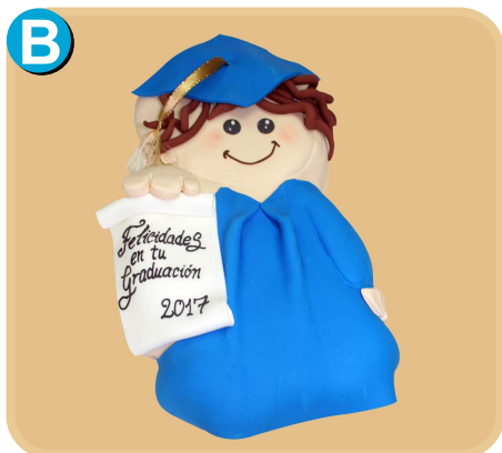
Forrada 510 disponible solo de 15 y 20 porc.