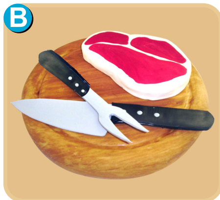
Forrada 711 disponible desde 10 porc.