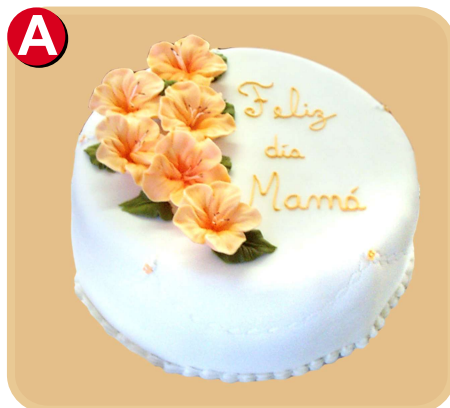
Forrada 602 disponible desde 10 porc.