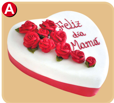
Forrada 601 disponible desde 10 porc.