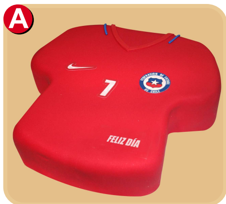
Forrada 704 disponible desde 10 porc.