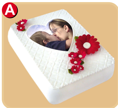
Forrada 605 disponible desde 10 porc.