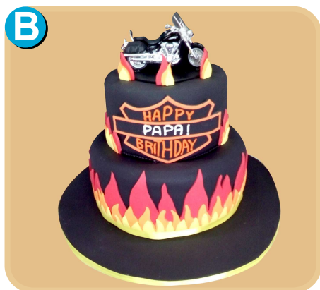
Forrada 716 disponible desde 30 porc.