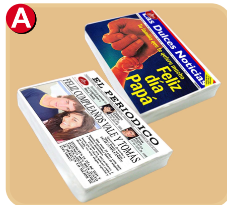
Forrada 712 disponible solo de 10 porc.