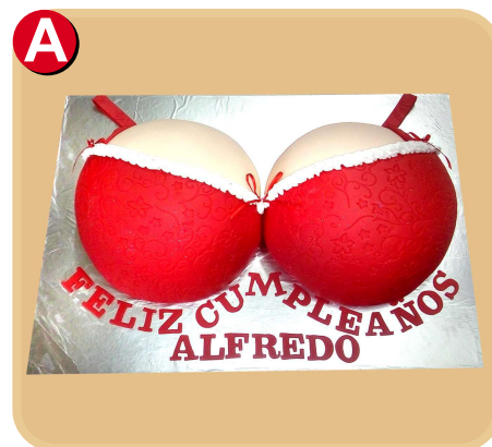
Forrada 715 disponible desde 20 porc.