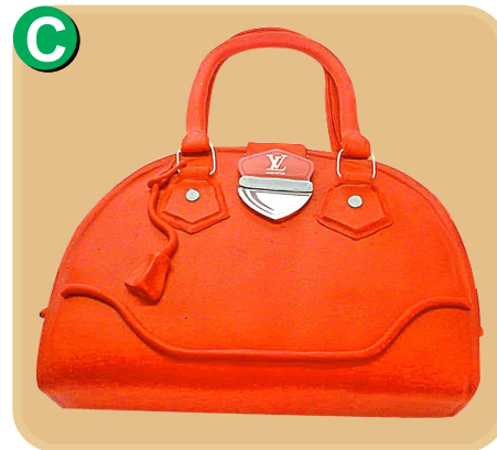
Forrada 612 disponible desde 20 porc.