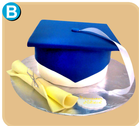
Forrada 511 disponible desde 15 porc.