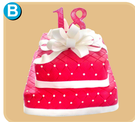
Forrada 512 disponible desde 30 porc.