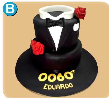
Forrada 703 disponible desde 30 porc.