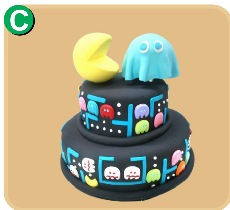
Forrada 708 disponible desde 30 porc.