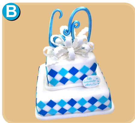
Forrada 517 disponible desde 30 porc.