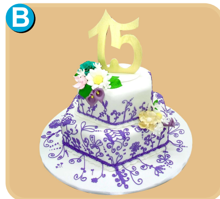
Forrada 503 disponible desde 30 porc.