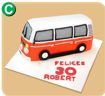
Forrada 717 disponible desde 25 porc.