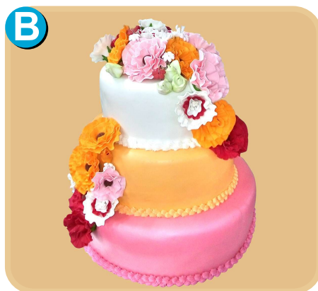
Forrada 608 disponible desde 45 porc.