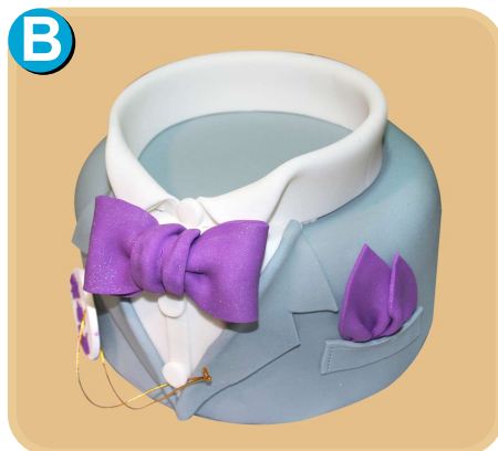
Forrada 702 disponible desde 10 porc.