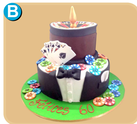
Forrada 518 disponible desde 30 porc.