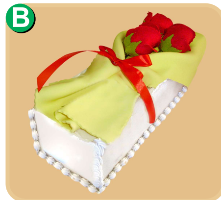
Forrada 603 disponible solo de 10 porc.