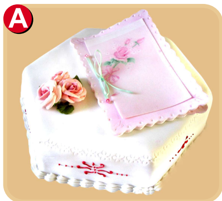
Forrada 604 disponible desde 10 porc.