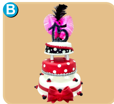
Forrada 506 disponible desde 45 porc.