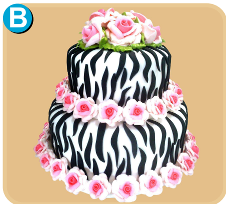
Forrada 616 disponible desde 30 porc.