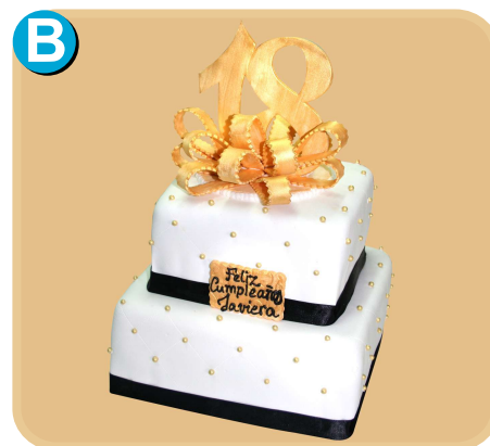
Forrada 509 disponible desde 30 porc.