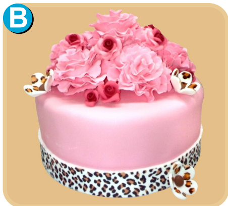
Forrada 613 disponible desde 15 porc.