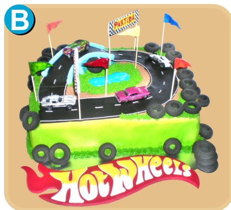
Forrada 308 disponible desde 30 porc.