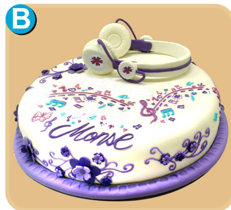
Forrada 324 disponible desde 15 porc.