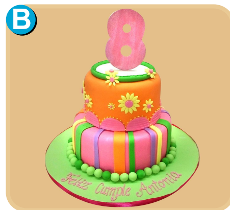
Fornada 318 disponible desde 30 porc.