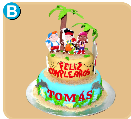
Forrada 306 disponible desde 30 porc.