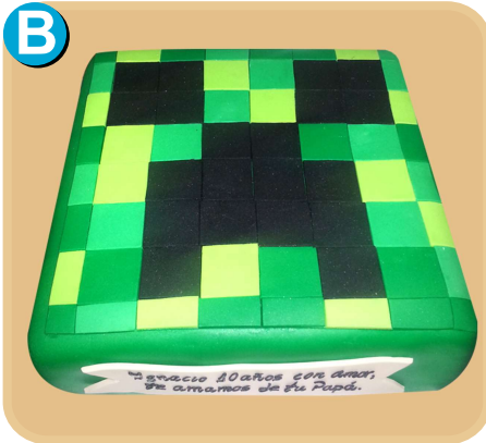
Forrada 328 disponible desde 15 porc.