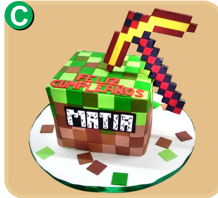
Forrada 329 disponible desde 20 porc.