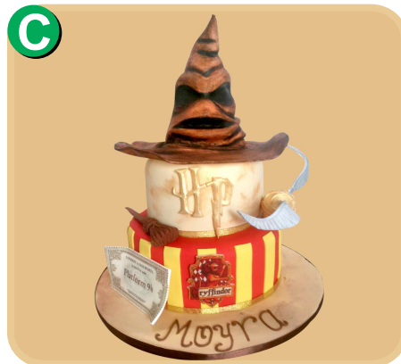
Forrada 405 disponible desde 30 porc.