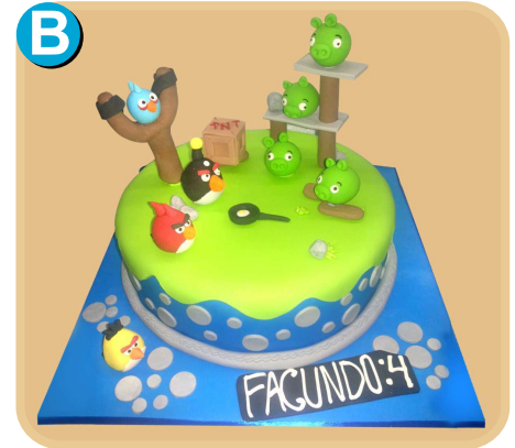
Forrada 330 disponible desde 15 porc.