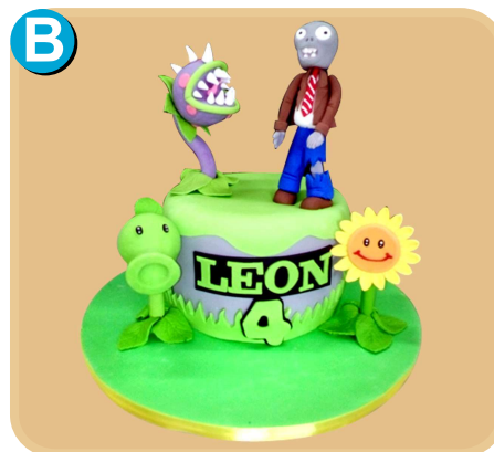
Forrada 335 disponible desde 15 porc.