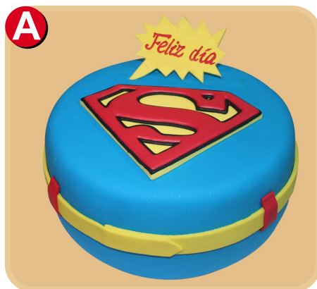
Forrada 338 disponible desde 10 porc.