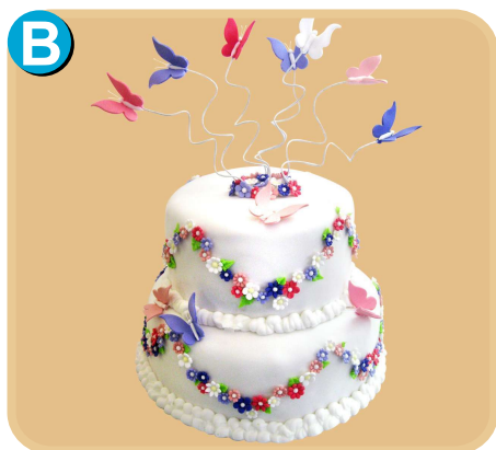
Fornada 316 disponible desde 30 porc.