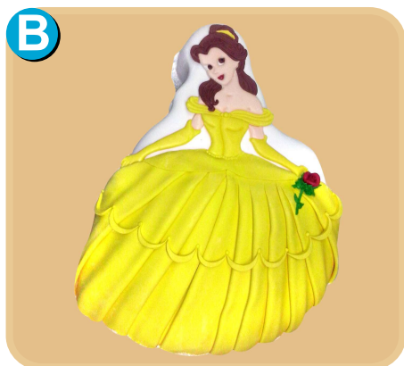
Fornada 313 disponible desde 20 porc.