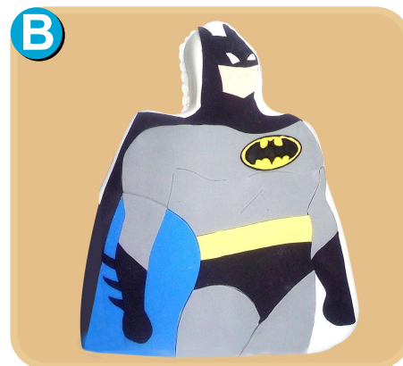
Forrada 342 disponible desde 20 porc.