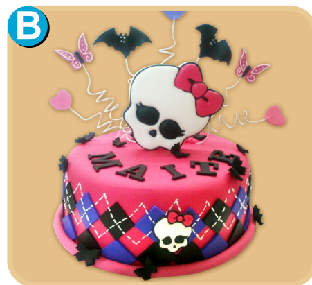
Forrada 327 disponible desde 15 porc.