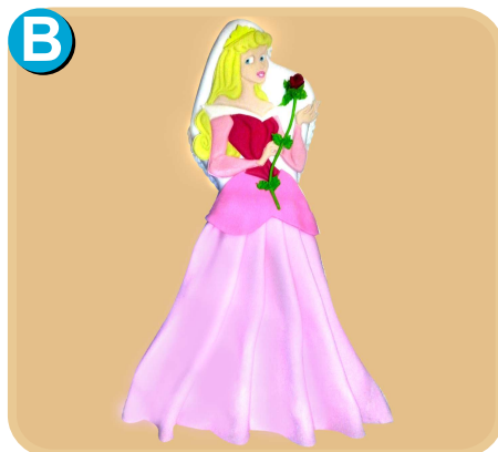
Fornada 311 disponible desde 20 porc.