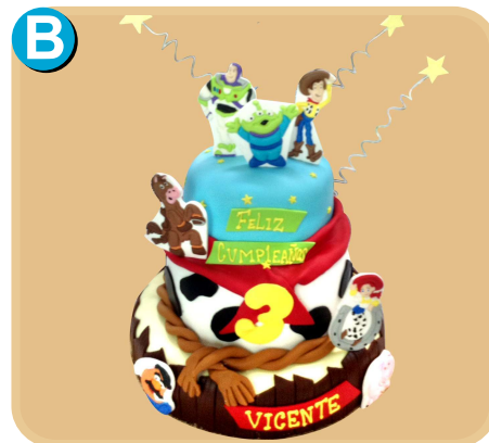
Forrada 303 disponible desde 45 porc.