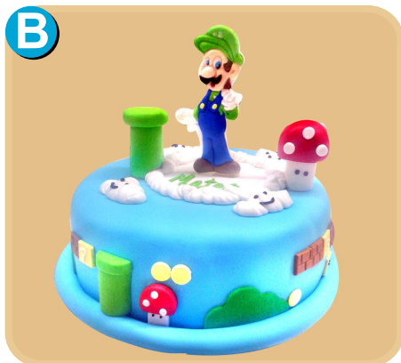
Forrada 301 disponible desde 10 porc.