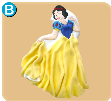
Fornada 314 disponible desde 20 porc.