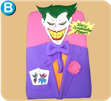
Forrada 401 disponible desde 15 porc.