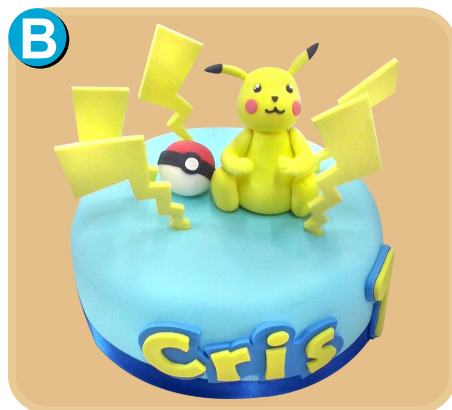
Forrada 305 disponible desde 15 porc.