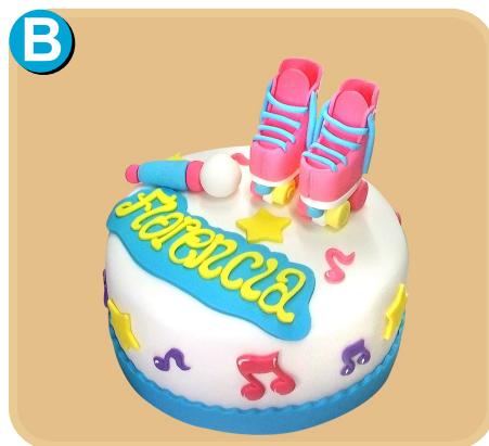
Forrada 326 disponible desde 15 porc.