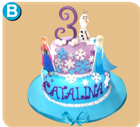
Forrada 320 disponible desde 30 porc.