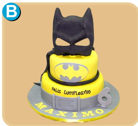
Forrada 344 disponible desde 30 porc.