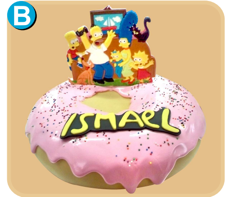
Forrada 403 disponible desde 15 porc.