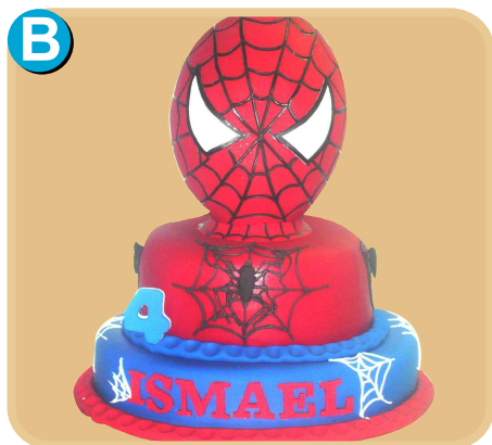
Forrada 340 disponible desde 30 porc.