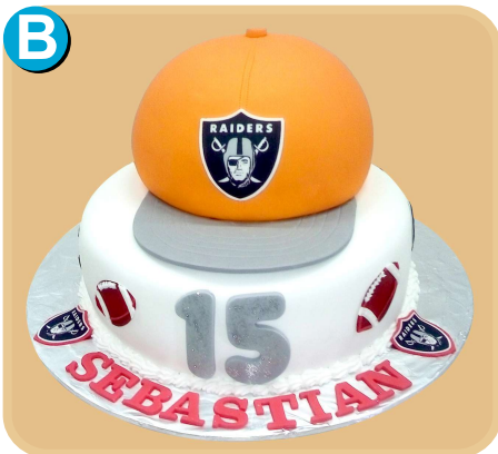
Forrada 404 disponible desde 30 porc.