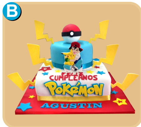
Forrada 302 disponible desde 30 porc.