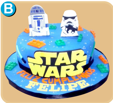
Forrada 331 disponible desde 15 porc.