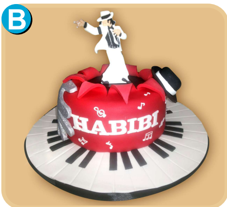
Forrada 407 disponible desde 15 porc.