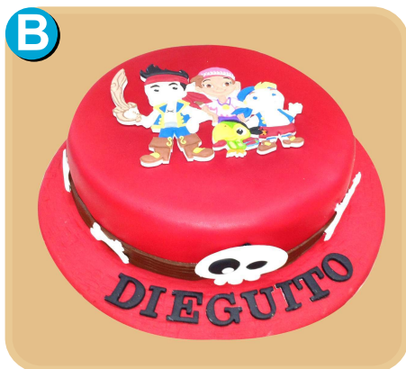
Forrada 304 disponible desde 10 porc.