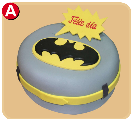
Forrada 337 disponible desde 10 porc.