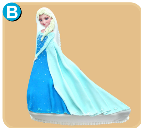
Forrada 323 disponible desde 20 porc.