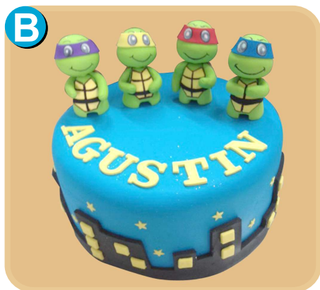
Forrada 343 disponible desde 15 porc.