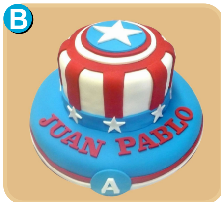
Forrada 341 disponible desde 30 porc.