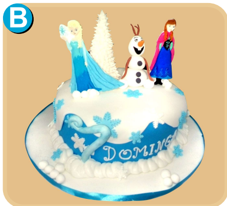
Forrada 319 disponible desde 15 porc.