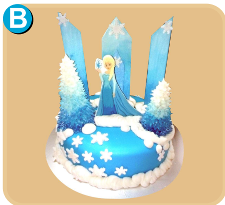
Forrada 322 disponible desde 15 porc.