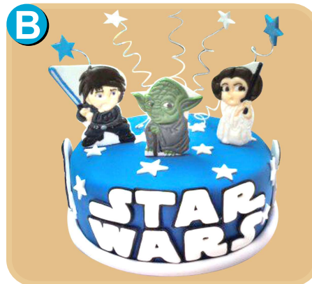
Forrada 332 disponible desde 15 porc.