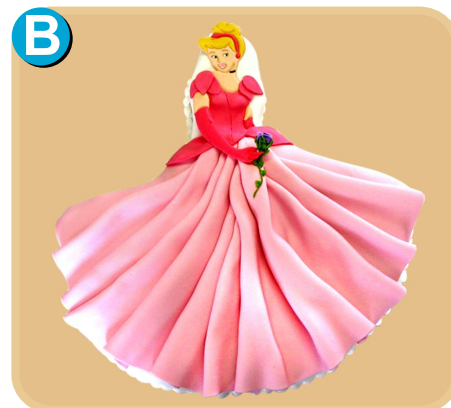
Fornada 312 disponible desde 20 porc.