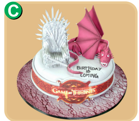
Forrada 406 disponible desde 20 porc.