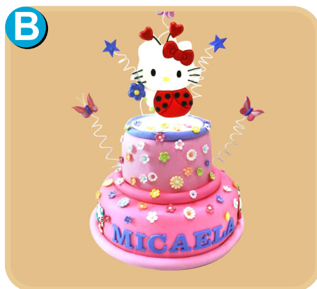
Fornada 317 disponible desde 30 porc.