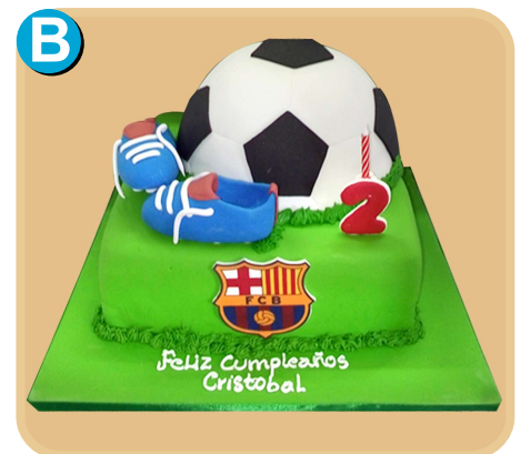
Forrada 336 disponible desde 25 porc.