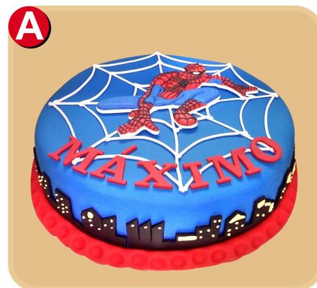
Forrada 339 disponible desde 10 porc.