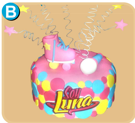
Forrada 325 disponible desde 15 porc.