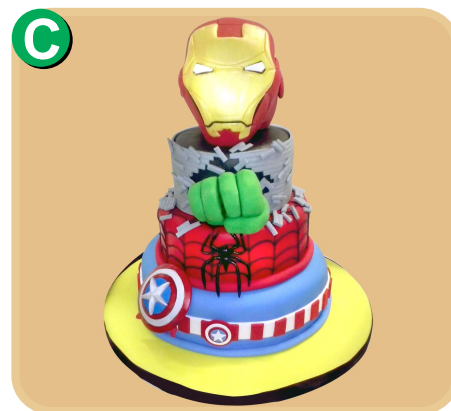
Forrada 345 disponible desde 45 porc.