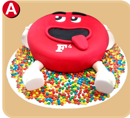
Forrada 402 disponible desde 15 porc.