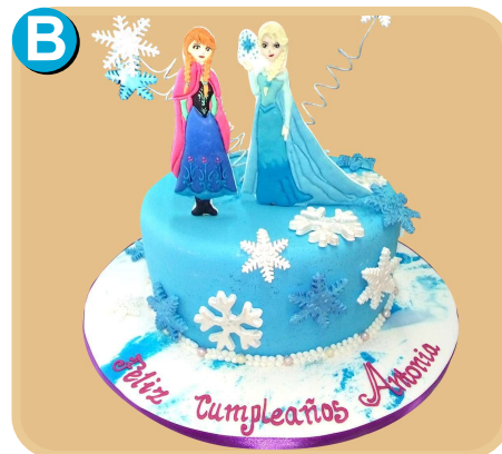
Forrada 321 disponible desde 15 porc.