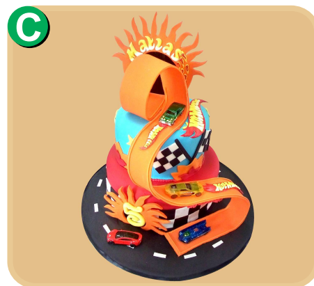
Forrada 309 disponible desde 30 porc.