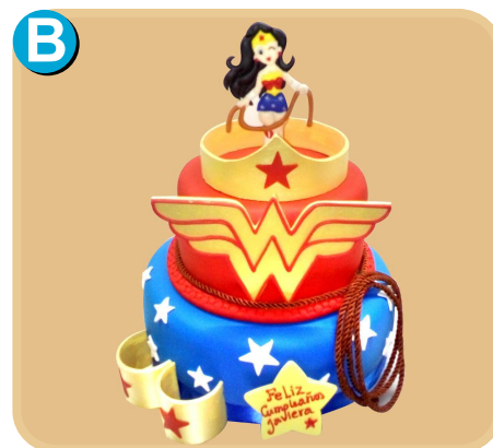
Fornada 315 disponible desde 30 porc.