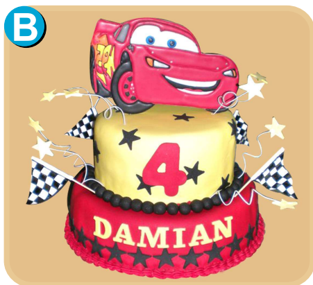
Forrada 307 disponible desde 30 porc.