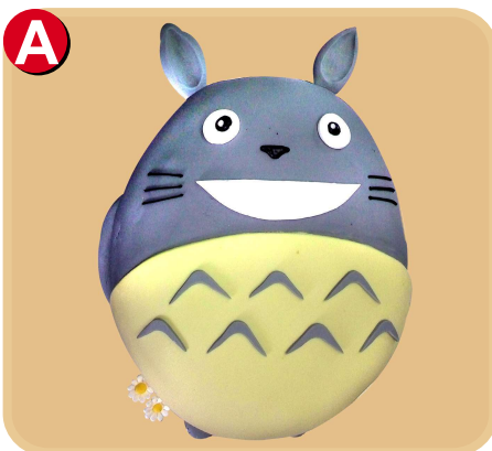
Forrada 334 disponible desde 20 porc.