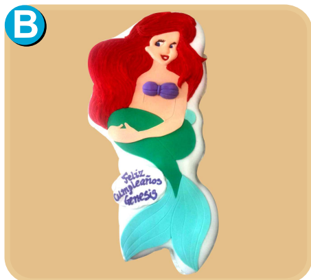
Fornada 310 disponible desde 20 porc.