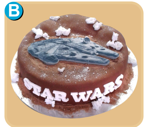
Forrada 333 disponible desde 15 porc.