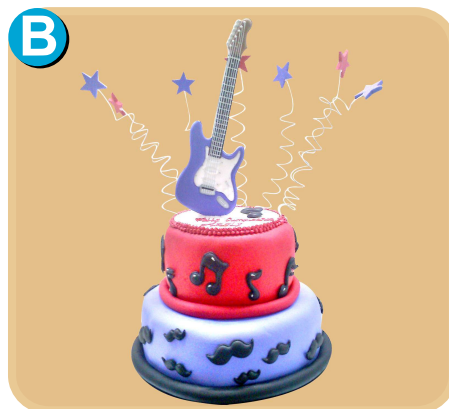
Forrada 408 disponible desde 30 porc.