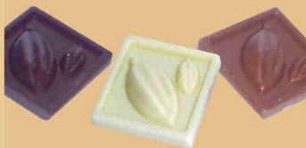
Monedas de chocolate bitter - leche - blanco