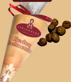
Besitos de almendras (60 grs.)