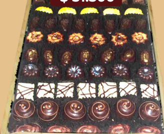
Bandeja bombón grande