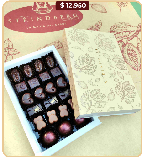
Estuche bombones N° 22