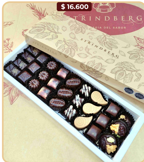
Estuche bombones N° 27