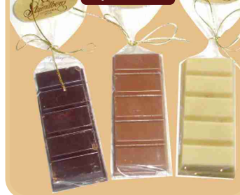
Barra bitter chica S/A Barra leche chica S/A Barra blanco chica S/A (35 grs.)