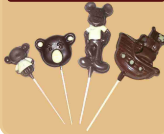
Paletas de chocolate chica - mediana - grande - xl