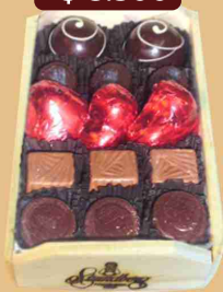
Bandeja bombón chica