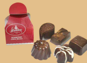
Caja bombón individual