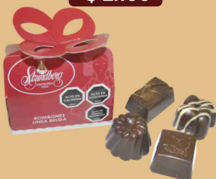
Caja bombones 40 grs. (4 unids.)