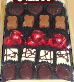
Bandeja bombón mediana